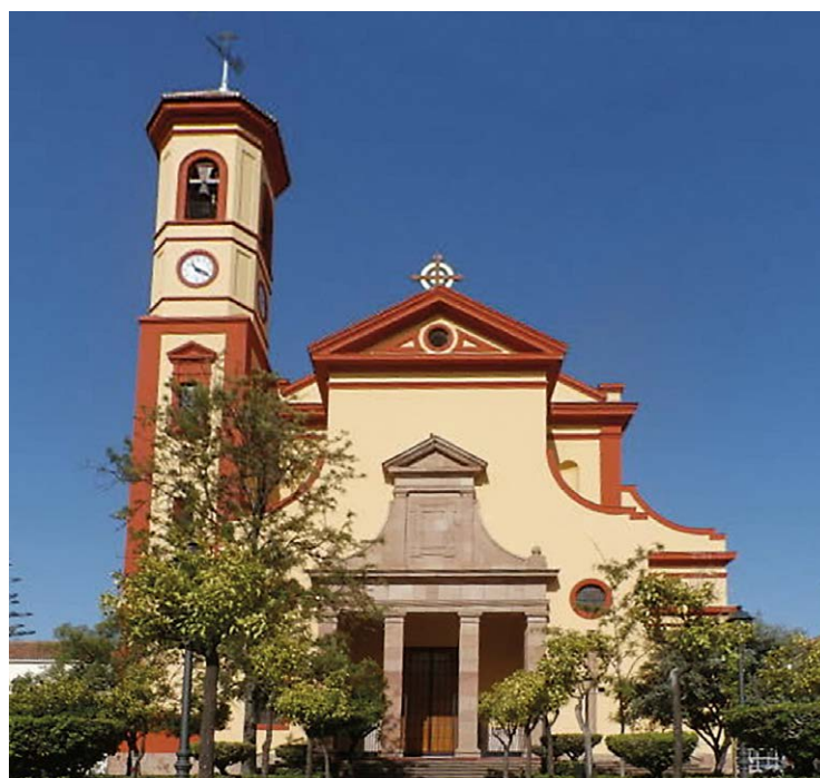
FACHADA PRINCIPAL PARROQUIA SAN JOSÉ OBRERO DE CARRANQUE