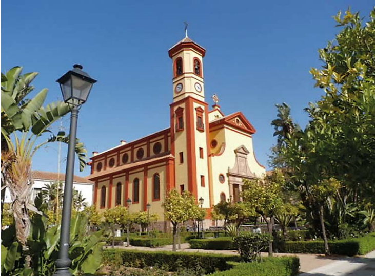
PARROQUIA SAN JOSÉ OBRERO. VISTA LATERAL DE LA FACHADA