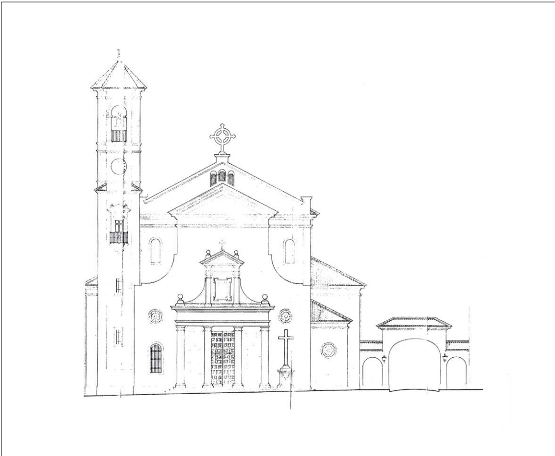
PLANOS S/F: ATENCIA, JÁUREGUI Y BURGOS. PORTADA PRINCIPAL IGLESIA. SAN JOSÉ OBRERO CARRANQUE

El Coro tendría acceso por la escalera de la Torre, el elemento destacado del conjunto y cierre de las perspectivas de varias vías de tráfico. Antecede a la entrada principal un amplio atrio arbolado que da acceso al pórtico de entrada,