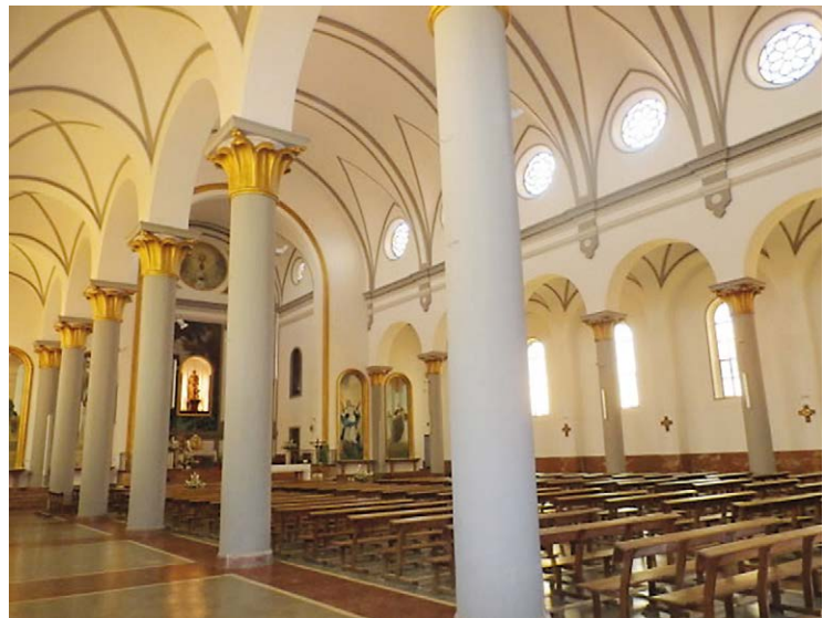
PARROQUIA SAN JOSÉ OBRERO. INTERIOR. VISTA DEL LATERAL DERECHO

El total de construcciones realizadas en cuatro años en Carranque, es de 2.161 viviendas, 127 locales comerciales (concentrados en la Plaza de Pío XII), y los edificios complementarios: Iglesia, edificios religiosos y sociales, así como centros educativos; de recreo: cafés, teatro-cine, etc.