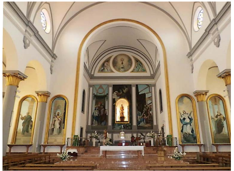
PARROQUIA SAN JOSÉ OBRERO. ALTAR MAYOR

La primera entrega de viviendas fue la del 18 de julio de 1958. Una reseña publicada en «Sur», en dicha fecha, informa que la Delegación Provincial del Ministerio de la Vivienda haría entrega al Ayuntamiento del Mercado Central de Abastos, construido en la barriada del Generalísimo Franco en Carranque. También entregaron a la Delegación Provincial del Frente de Juventudes el edificio social de la barriada para la instalación de un colegio menor, y pondrían a disposición de la autoridad eclesiástica la casa de Acción Católica, y la casa parroquial, edificadas para sus fines específicos. Por no estar totalmente terminados, quedaban pendiente de entrega, para fecha próxima, la iglesia parroquial, un grupo escolar a la Jefatura Provincial del Movimiento para escuela de Formación Profesional de la mujer, tres grupos escolares, y una guardería infantil. También informaban que, en fecha muy próxima, se anunciarían los sorteos correspondientes para la adjudicación de mil viviendas en aquella barriada, de las cuales se entregarían inmediatamente todas las ya terminadas, y el resto sin interrupciones, conforme se fueran terminando. Estos sorteos se realizarían ante notario, por grupos, y con carácter público. 3