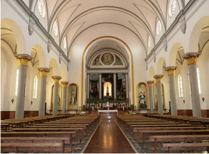
PARROQUIA SN JOSÉ OBRERO. INTERIOR DESDE LA ENTRADA PRINCIPAL

del Generalísimo Franco (Carranque), procediéndose a su apertura. A continuación, se leyó una Moción del Tte. Alcalde Delegado de Mercados, dando las normas y ordenanzas con sus tarifas correspondientes. En dicha Moción, se decía que consideraba prematuro proceder a la inauguración del mercado por no estar totalmente habilitada la barriada, faltando muchas viviendas por adjudicar, y otras muchas en construcción. Pese a ello, consideraba que se podía proceder a la subasta de las casetas y puestos del referido mercado. Con ello se pretendía quitar los actuales «puestecillos» situados en algunos lugares, y las tiendas que existían en los pisos particulares, sin permiso alguno, y que eran los que hasta entonces abastecían al vecindario. 4